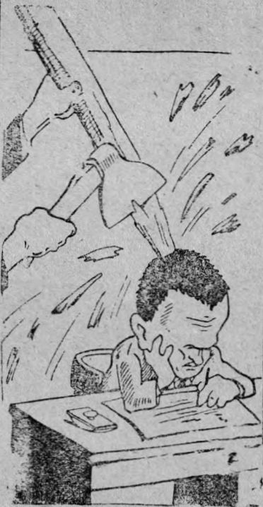
Неужели не почувствует?